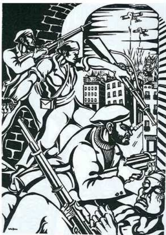
Cartell sobre la revolta d'Astúries l'any 1934