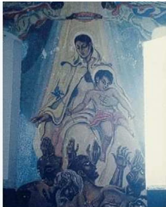
"Capilla gitana", obra mural realitzada a la presó Model de Barcelona

La derrota republicana el portarà a diferents camps de concentració, primer a França i després a Algèria. El 1942, ja alliberat, tornarà a Espanya on crearà el grup Liberamiento Nacional Republicana l'any 1944, fet que el portarà a ser empresonat de 1945 a 1946 i de 1948 a 1954. Pintarà la Capilla gitana , a la fatídicament coneguda com a presó Model de Barcelona, obra mural que encara avui dia s'està lluitant per la seva conservació, va ser blanquejada però el 1996 es va poder recuperar. A causa del seu empresonament la salut de Helios es ressent greument i mor a Barcelona el 1956.