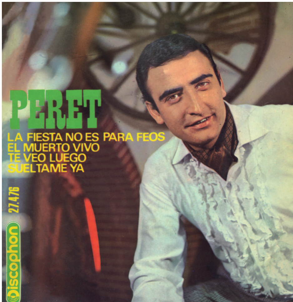
◀ Editado por Discophon. 1966

una copa de manos de Evita Perón como ganadores de un concurso organizado para agasajar a la primera dama argentina. Peret era un guitarrista autodidacta, pero será un accidente de motocicleta a mediados de los años cincuenta en Palma de Mallorca lo que le inclina definitivamente hacia el arte (y gracias al que se libra de la mili). "Fue en ese momento cuando me tomé en serio la guitarra aunque en mi familia nadie había sido artista", recuerda.