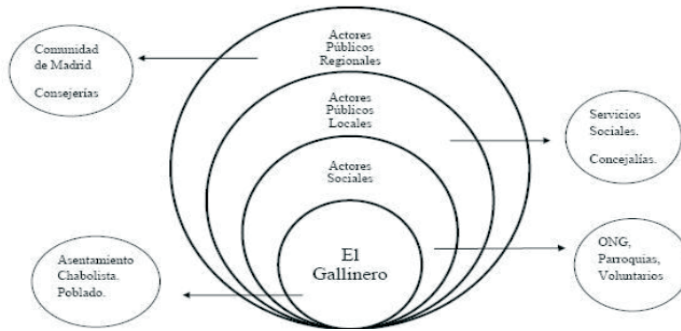
Figura 1: Actores en El Gallinero